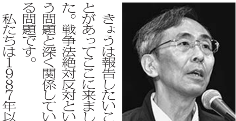
集会の最後に、全発言者と学生が登壇し戦争法案阻止・安倍打倒の決意をこめて団結ガンパロー