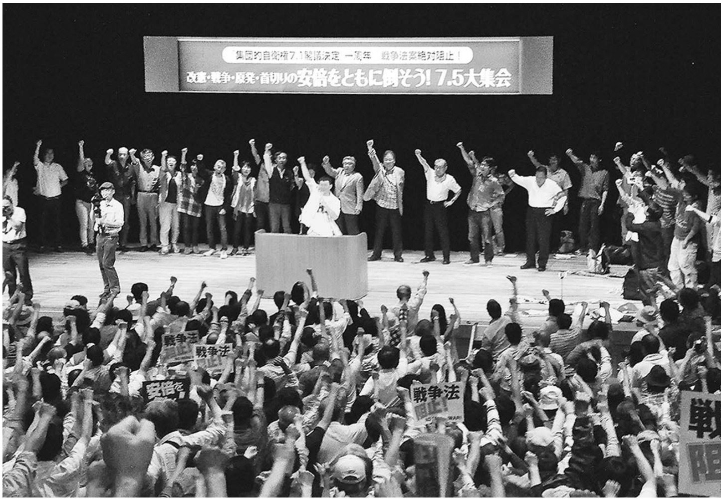
集会の最後に、全発言者と学生が登壇し戦争法案阻止・安倍打倒の決意をこめて団結ガンパロー

今、長崎では8月9日の準備に入っています。市長の平和宣言は、市長の指示によって選ばれた長崎市長の代表が起草委員会をもって内容が検討されています。第一回目の会合で市長は驚きました。左の起爆委員会のメン